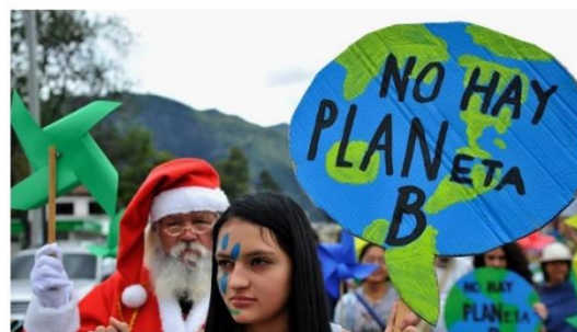
NO hay planeta B, NO hay plan B

innovador, a nivel local y distrital, a través de la formación integral de sus estudiantes y la intensificación de las áreas básicas y fundamentales del conocimiento, en coherencia con el modelo del aprendizaje significativo, acorde con una cultura sostenida de calidad y una acción transformadora en sus prácticas pedagógicas, en cohesión con el sentido de responsabilidad social y política de la educación en Colombia..” Gracias a nuestras acciones positivas y de generación del cambio en la era del postconflicto, ya que nosotros como docentes construimos LA GENERACIÓN DE LA PAZ.